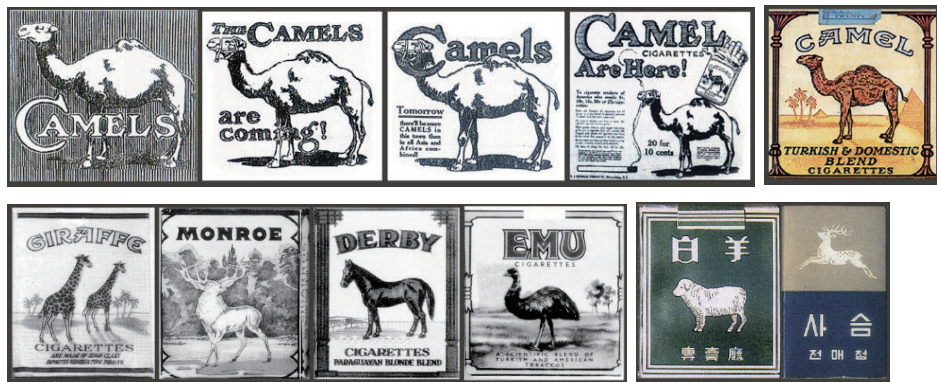
Figure 33 The teaser advertisement with the copy 'the Camels are coming'

카멜은 1914년 미국 본지에서 출시될 당시 광고 형식과 포장디자인에서 주목받았던 담배로, 한국에서는 해방을 전후하여 인기리에 판매된 대표적인 양담배였다. '카멜이 오고 있다'는 호기심을 자극하는 광고 문구와 함께 등장한 카멜 담배 포장디자인은 미국 내 카멜의 판매량을 극적으로 끌어올렸다는 평가를 받을 만큼 성공적인 디자인으로 인식되었다.(Eric Burns, 2015)(Figure 33,34) 서구의 담배 포장디자인 역사를 기술한 크리스 뮐렌은 "면 풍경을 배경으로 동물의 측면 형상을 대조적인 크기로 배치한 구성"을 카멜식 담배 포장디자인으로 정의하고, 이러한 시각적 구성의 명료함이 상업적 성공을 거둔 브랜드의 조형 어법으로 인식되어 '카멜식' 담배 포장의 유행을 가져왔다고 진단한다.(Chris Mullen, 1979) 상업적 가치를 증명한 이러한 조형 방식의 확산으로 나타나 있던 자리에 기린과 산양, 당나귀와 타조 등이 등장했고(Figure 35) 한국에서는 예로부터 신성한 기운을 가진 동물로 인식되어 온 백양(白羊)이 등장했다. 백양에 이어 1957년에 발매된 사슴 담배 포장디자인의 경우에도 카멜식 담배 포장의 조형 어법을 연상하게 한다.(Figure 36)