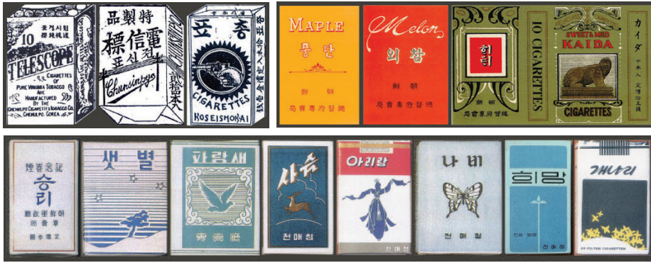
Figure 14 The tobacco packaging design published in the tobacco advertisement of Maeil Shinbo (1907-1915)