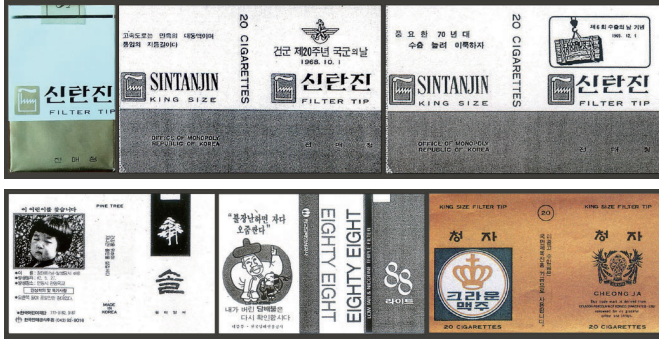
Figure 41 The original packaging design of 'Shintanjin' in 1968 and an example of margin application Figure 42 Various advertisements inserted in tobacco packaging after 'Shintanjin' packaging design

1968년도 신탄진 담배 포장디자인은 이러한 상황 속에 등장했고, 기존 신탄진 담배 포장디자인의 이미지와 유사하면서도 다른 특징을 나타냈다. 그 특징이란, 여백 중심의 공간 구성을 활용한 조형 방식으로 여기서 여백은 레이아웃의 중심 기능을 수행한다. 국가가 주조한 이념의 다양한 표상들은 이러한 여백을 일정한 공간으로 확보하고 등장한다. 빈 여백은 1950년대 담배 포장디자인의 목표였던 미술적 가치를 담지한 포장 도안의 시각 요소로 기능하는 대신, 1960년대 국가 이념을 반영한 각종 슬로건과 도안이 배치되는 기능적 조형 공간의 특징을 띄게 된다. 담배 포장디자인의 전체적인 이미지를 좌우하는 미적 요소로 고려되어야 할 여백이 아니라, 언제든지 필요에 따라 어떤 내용이든 채워 넣을 수 있는 표준화된 빈칸으로 활용된 것이다.(Figure 41)