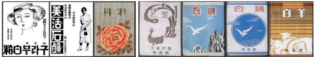
Figure 12 Lettering logos of cosmetics, soaps and cigarette products distributed during Japanese occupation

해방기 담배 포장디자인에서 눈에 띄는 구성 요소인 한글 로고와 한자 로고의 경우에는 일제강점기 상품 로고 디자인의 특징을 공유한다. 이들 로고의 공통된 특징은 레터링 현상이 두드러진다는 점이다. 레터링이란, 조형미를 고려하여 글자를 쓰는 행위로 언어적 표기에 충실한 '쓰기'이기보다는 특정한 목적의 글자를 시각적으로 강조하기 위한 '도안'의 성격을 갖는다. 대부분의 상품 로고는 이러한 레터링 과정을 통해 제품의 이미지를 시각화하는데 이 시기의 한글, 한자 로고 역시 이와 같은 특징을 나타낸다.