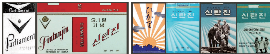
Figure 39 The packaging design of the American tobacco 'Parliament' and its copied 'Shintanjin' packaging design in 1965 Figure 40 The packaging design of 'Shintanjin' in 1966, reminding people of Japanese Rising Sun Flag

담배 포장을 국가가 내세운 이념과 정책을 홍보하기 위한 도구로 활용하는 이와 같은 양상은 해방 이후 1960년대 중반까지 유통된 담배 포장 디자인에서도 흔하게 발견되는 특징이지만, 정형화된 조형적 구조를 가진 것은 아니었다. 그러나 1965년에 준공된 신탄진 연초제조창의 필터 담배 대량생산을 기념하여 출시된 이후, 독립적인 제품군을 형성한 신탄진 담배 포장디자인에서는 1990년대까지 지속된 국가정책 홍보를 위한 규격화된 조형적 레이아웃이 마련된다. 이는 1965년에 도안된 신탄진 담배 포장디자인을 재디자인한, '1968년도 신탄진 담배 포장디자인'에서 구체화 된다.