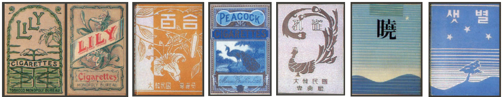
Figure 1 'LILY', the tobacco produced by Japanese Monopoly Bureau during Japanese occupation

시각적 유사성이라는 측면에서 볼 때, 일제강점기 담배 포장디자인의 영향은 담배 명칭과 연관된 소재와 조형 방식에서 감지된다. 일제강점기 담배 포장디자인에는 행복과 부귀를 상징하는 꽃과 새, 서정적인 자연 풍경을 연상하게 하는 담배 명칭과 이를 표현한 이미지가 형상화되었는데 해방 이후 담배 포장디자인에서도 동일한 특징이 발견된다. 담배 명칭의 경우, 백합과 같이 문자 표기만 다를 뿐 같거나(Figure 1,2) 공작(孔雀), 계명(鷄鳴), 셋별의 경우처럼 해방 이전에 발매된 담배 제품의 명칭과 유사한 범주의 담배 이름이 사용되고 있다.(Figure 3,4,5,6)