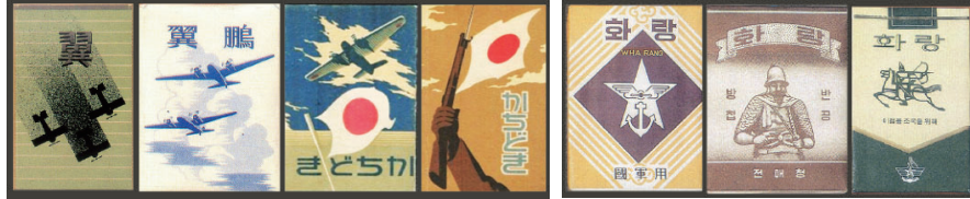
Figure 22 The tobacco packaging design for military, released by Japanese Monopoly Bureau during the Pacific War

국군 창설 기념으로 1949년에 발매된 화랑의 경우에는 일본전매청이 태평양 전쟁기(1941 - 1945)에 생산한 군용 담배의 유형을 띠는 가운데 담배 명칭을 '화랑'으로 표기함으로써 민족적 정서를 자극하는 시각성을 나타냈다.(Figure 22,23) 담배 포장을 구성한 국군 문장(紋幟)과 한글 로고의 조합을 볼 때, 표면적으로는 군대 문장이 두드러지지만 시각적인 주목도는 담배 명칭인 화랑에 집중된다. 그러나 이때의 주목도는 조형적 특징보다는 대한제국기부터 일제강점기를 거쳐 해방 이후 대한민국 정부 수립에 이르기까지 누적된, '민족의 표상으로서 화랑'에 대한 역사적 담론과 관계한다고 볼 수 있다.