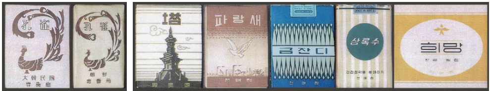
Figure 37 The tobacco packaging design by manual plate making

당시 전매청 인쇄소에서 발간한 포장 도안집에는 이러한 장식성이 도출된 환경을 이해할 수 있는, 담배 포장 생산과 관련된 시대적 인식이 기술되어 있다. 전매제도의 시행이 무색할 정도로 양담배 소비가 만연한 상황에서, "한국전쟁 이후 수입된 선진 인쇄기기를 십분 활용하여 경쟁력 있는 포갑지 도안에 주력해야 한다"는 의지를 밝히고 있다. "구미 선진국의 인쇄기기를 도입함으로써 생산 환경의 면목을 일신하였으니, 이후의 사명은 이러한 인쇄기기의 기술을 연마하여 더욱 미려(美麗, 아름답고 고운)한 포갑지 생산에 주력하는데 있다"고 강조한다. 한국전쟁 이후를 분기점으로 하는 이러한 인식은 당대의 관제담배 포장디자인이 도모해야 할 미술적 가치 향상의 한 축이, 인쇄 기술의 쇄신에 있음을 전제했 것으로 이는 다음과 같은 특징의 담배 포장디자인을 출현시켰다.