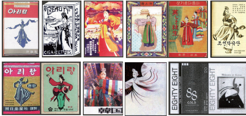
Figure 24 The 'Arirang' packaging design presenting a woman dancing 'Hwagwanmu'