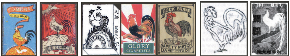
Figure 7 The packaging design of 'Gyemyeong', the tobacco produced for commemorating the establishment of Republic of Korea

무엇보다 주목되는 것은 이러한 담배 명칭을 시각적인 차원에서 강화하고 있는 장식 도안의 표현 방식이다. 담배 이름으로 호명된 대상의 이미지를 익숙한 형태로 묘사하는 방식은 일제강점기 담배 포장디자인에서 볼 수 있는 일반적인 특징으로, 해방기 담배 포장디자인에도 이어진다. 담배 명칭과 연관된 표현 소재를 기하학적인 선이나 면으로 구성된 추상적 형태가 아니라, 대상이 가진 본래의 특징을 즉각적으로 인지할 수 있는 구체적인 형태로 표현하고 있다. 이외에도 특정한 담배 포장디자인의 경우에는 일제강점기에 유통된 상업적 시각물의 주요 이미지를 그대로 옮긴 양상을 보이기도 한다.