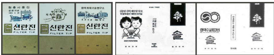
Figure 43 The packaging design structure of 'Shintanjin' visualizing a national policy

한편, 이처럼 1950년대 담배 포장디자인에 기반한 특정한 조형 양식이 1960년대 담배 포장디자인의 관제적 시각성을 일관되게 생산하는 틀이었다면, 그 속에 위치한 시각 요소들은 내용의 차원에서 이 시기에 생산된 담배 제품의 관제적 특성을 강화한다. 국가라는 이미지를 상기시키는 로고와 삽화, 계몽 표어 등은 일정한 여백을 확보한 레이아웃 위에 배치되면서 전매 담배라는 이미지를 강력하게 구축한다. 특히 이러한 시각성은 "특수의장 담배 포갑지"로 분류된 기념 담배 포장디자인에서 뚜렷하게 감지된다. 특수의장 담배 포갑지는 1960년대 이후 1990년대 초반에 이르기까지 30여년 간 유지된 담배 포장 형식으로, 국가정책을 홍보하고 기념하는 시각적 구성을 특징으로 한다.(Figure 43,44)(한국담배의장, 1992)