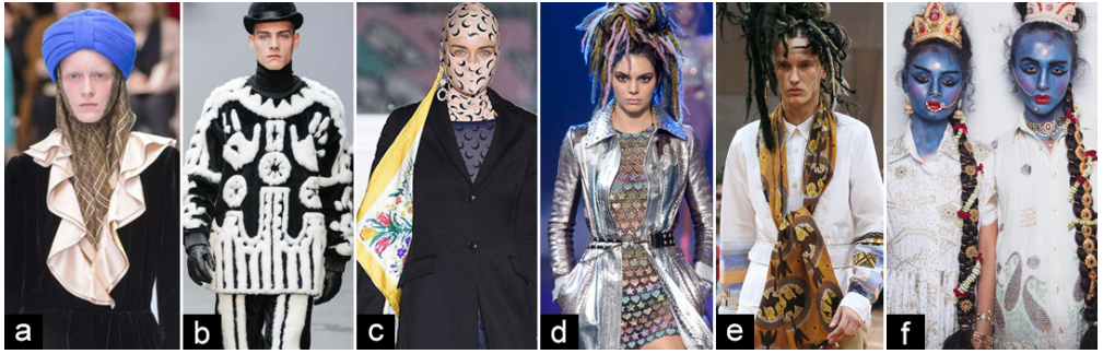
Figure 1 Fashion collections that are accused of culturally appropriating Sacred Symbols

둘째, 타 지역의 유산으로 남겨진 전통문화표현을 전유한 경우도 많은 논란이 있었다. 빅토리아 시크릿 (Victoria's Secret)의 컬렉션은 이와 같은 경우에 가장 대표적인 사례로 언급되며 반성 없이 반복되는 문화적 실책의 예로 자주 거론된다. 환상적 판제리 패션쇼를 연출한다는 미명 하에 런웨이에 선 모델들은 여러 지역별 토착민들의 고유한 의상과 액세서리들을 머리부터 발끝까지 쉽게 납득하기 어려운 조합으로 착장하곤 한다. 특히 아메리카 원주민 인디언들의 전통 모티프들을 조합한 사례가 많고 그 외 아프리카 토착민들의 의상, 그리고 아시아의 전통 의상을 가져온 경우도 있다. 빅토리아 시크릿이 2010년부터 매해 문화적 전유로 비난받는 패션쇼를 기획하고 있음을 기사화한 한 보도 자료에 의하면 특히 2017년의 경우 소수 토착지역의 문양, 비딩 장식에 인디언 전투모자까지 조합된 의상을 선보였다고 설명하였다(Figure 2-a)(Heller, 2017b).