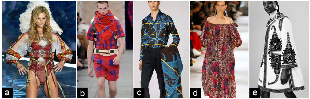
Figure 2 Fashion collections that are accused of culturally appropriating Traditional Expressions

셋째, 토착의 표현물들은 토착민의 의사와 상관없이 패션산업의 트렌드로 대량 소비되기도 하는데, 같은 시즌에 여러 브랜드가 한 지역을 대상으로 인스피레이션을 얻게 되므로 논란의 내용이 중복되기도 한다. 앞서 소개했듯이 코콘투자이가 이누이트 컬렉션을 선보였던 2015 F/W 시즌에는 캐나다 브랜드 디스퀘어드투(Dsquared2)도 이누이트 의상을 중심으로 컬렉션을 전개하였다(Figure 3-a). 디스퀘어드투는 해당 시즌의 의상을 소개함에 있어 캐나다-인디언들의 의상으로부터 영감을 받았으며 아메리카의 원형과 오래된 유럽의 만남을 보여준다고 소개함으로써 역시 문화적 전유로서 논란의 중심에 섰다(Brucculieri, 2015). 원주민 이누이트의 전통복을 형상화하거나 토착민 의상을 참고한 드레스에 군복 재킷을 매치하는 등의 디자인에 대해 대중들은 '식민주의에 대한 미화'라고 비난하였다. 특히 컬렉션 타이틀을 'Dsquaw'라는 신조어로 소개하였는데 'squaw'라는 단어가 모욕적인 표현으로서 북미 원주민 여자를 표현하는 어휘였으므로 토착 문화에 대한 무례함이 그대로 드러난 경우였으며 결국 디자이너들이 서면으로 정식 사과를 해야 했다. 동일 시즌 트렌드로서 활용된 이누이트의 전통문화는 코콘투자이, 디스퀘어드투 이외에 안나수이(Anna Sui) 등의 여러 컬렉션에서도 함께 등장하였다(Figure 3-b).