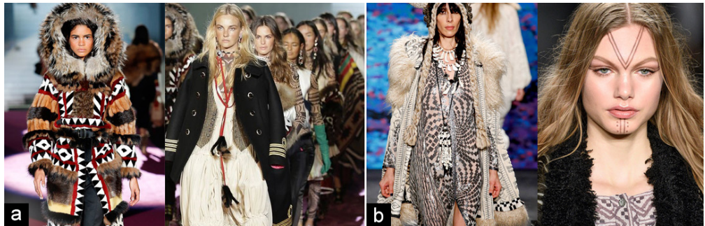
Figure 3 Fashion Trends that are actually cultural appropriation

셋째, 토착의 표현물들은 토착민의 의사와 상관없이 패션산업의 트렌드로 대량 소비되기도 하는데, 같은 시즌에 여러 브랜드가 한 지역을 대상으로 인스피레이션을 얻게 되므로 논란의 내용이 중복되기도 한다. 앞서 소개했듯이 코콘투자이가 이누이트 컬렉션을 선보였던 2015 F/W 시즌에는 캐나다 브랜드 디스퀘어드투(Dsquared2)도 이누이트 의상을 중심으로 컬렉션을 전개하였다(Figure 3-a). 디스퀘어드투는 해당 시즌의 의상을 소개함에 있어 캐나다-인디언들의 의상으로부터 영감을 받았으며 아메리카의 원형과 오래된 유럽의 만남을 보여준다고 소개함으로써 역시 문화적 전유로서 논란의 중심에 섰다(Brucculieri, 2015). 원주민 이누이트의 전통복을 형상화하거나 토착민 의상을 참고한 드레스에 군복 재킷을 매치하는 등의 디자인에 대해 대중들은 '식민주의에 대한 미화'라고 비난하였다. 특히 컬렉션 타이틀을 'Dsquaw'라는 신조어로 소개하였는데 'squaw'라는 단어가 모욕적인 표현으로서 북미 원주민 여자를 표현하는 어휘였으므로 토착 문화에 대한 무례함이 그대로 드러난 경우였으며 결국 디자이너들이 서면으로 정식 사과를 해야 했다. 동일 시즌 트렌드로서 활용된 이누이트의 전통문화는 코콘투자이, 디스퀘어드투 이외에 안나수이(Anna Sui) 등의 여러 컬렉션에서도 함께 등장하였다(Figure 3-b).